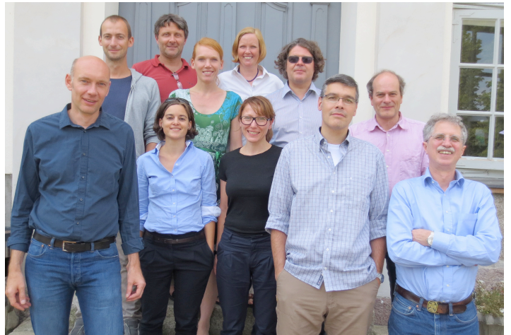
Das DFG-Netzwerk „Philosophie der Lebenswissenschaften in Deutschland“ bei seinem letzten Treffen im August 2013