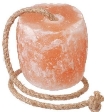
Figura 1: bloco de sal rosa do Himalaia para bovinos e equinos.

O criador pode suplementar o animal junto com o bicarbonato de sódio na ordem de 270 g de bicarbonato e 180 g de óxido de Mg/vaca/dia. No organismo animal, apenas 16% do elemento é absorvido. Mesmo o milho, pobre em minerais, fornece 1,2 g/kg do mineral, quantidade suficiente para os bovinos de corte. As principais fontes de Mg são os farelos de trigo, algodão e de soja, o milho, a farinha de carne e ossos, o sulfato e o carbonato de Mg (com 44% de coeficiente de absorção) e o óxido de Mg (entre 28 e 49% de coeficiente de absorção).