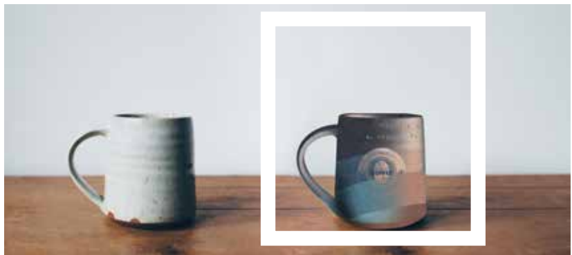
Ilustración digital: Gerardo Mercado