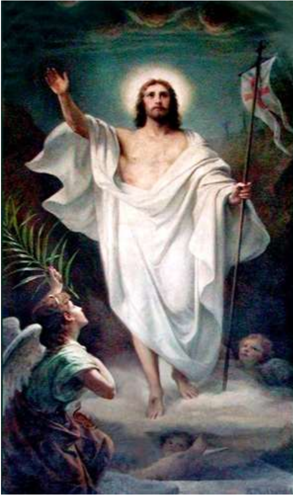
(Victorie asupra mormântului, de Bernard Plockhorst)

Noul Testament leagă Cina cea de taină și crucificarea lui Iisus de Paștele evreiesc și exodul din Egipt. Iisus s-a pregătit pe el însuși și pe discipolii săi pentru moartea sa în timpul Cinei, dând mesei de Paștele evreiesc un nou înțeles. El a identificat pâinea și cupa de vin ca simbolizând corpul său care va fi sacrificat curând și sângele său care urma să fie vărsat. În Prima Epistolă către Corinteni a Sfântului Apostol Pavel, Capitolul 5, el spune: “Curățiți aluatul cel vechi, ca să fiți frământătură nouă, precum și sunteți fără aluat; căci Paștile nostru Hristos S-a jertfit pentru noi.” , făcând referire la tradițiile Paștelui evreiesc și identificându-se cu mielul Pascal.