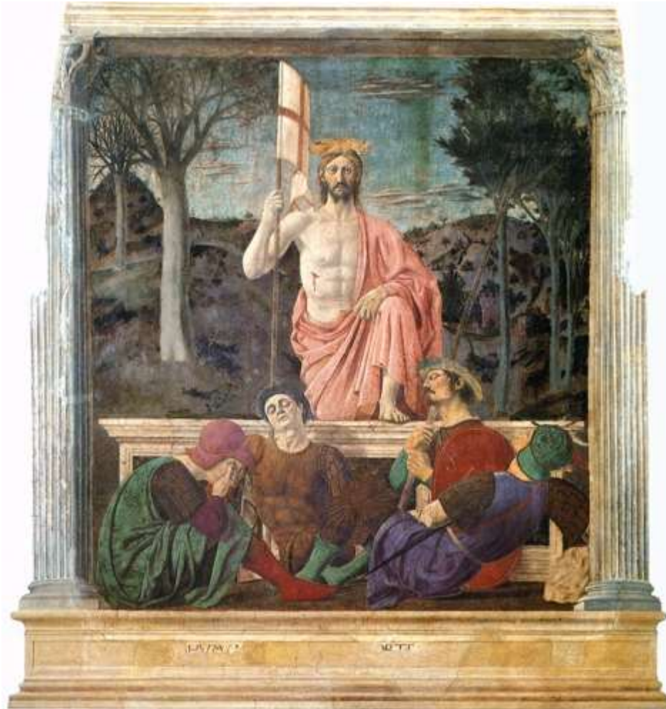
(Piero della Francesca - Învierea)

Paștele este o sărbătoare religioasă cu dată schimbătoare, atât în calendarul iulian cât și în cel gregorian. În fapt, data în care se celebrează Paștele se determină pe baza unui calendar lunisolar similar cu calendarul ebraic. Primul Consiliu de la Niceea (325) a stabilit ca dată a Paștelui prima duminică după luna plină (Luna plină pascală) de după echinocțiul de primăvară din emisfera nordică. Din punct de vedere ecleziastic, echinocțiul este considerat a fi la data de 21 martie (chiar dacă din punct de vedere astronomic cele mai multe echinocții sunt pe 20 martie), iar “Luna plină” nu este neapărat o dată corectă din punct de vedere astronomic.