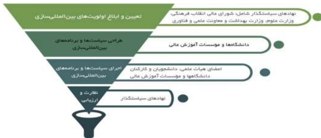
شکل ۱: سیاست گذاری آموزش عالی بین المللی از بالا به پایین

ایده اصلی فرایند از پایین به بالا آن بود که دستیابی به آینده مطلوب دانشگاه در بازاریابی بین المللی مستلزم شکل گیری