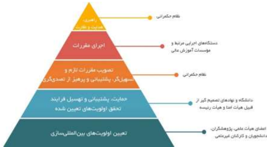
شکل ۲: سیاست‌گذاری آموزش عالی بین‌المللی از پایین به بالا