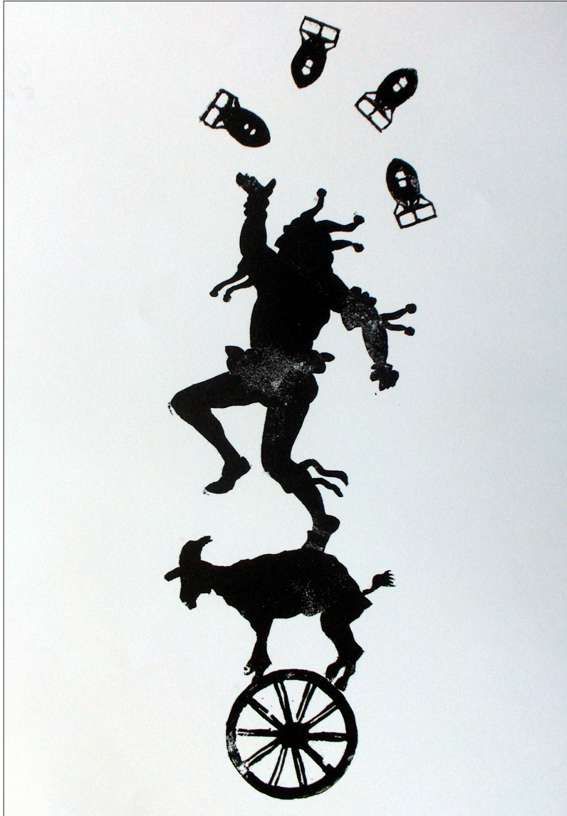
GABRIEL ACUÑA RODRIGUEZ Praxis descensos , de la serie "La basura de los días" Linograbado, 50 X 35 cm (2007)