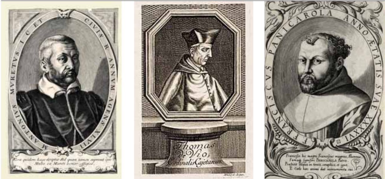
Da sinistra: Marc-Antoine Muret (1526-1585), in una vignetta della fine del XVI secolo; il cardinale Cajetano , Tommaso de Vio (1469-1534), in una vignetta del XVII secolo; Francesco Panigarola (1548-1594), in una incisione degli inizi del XVII secolo. Nella pagina accanto: Carlo Crivelli (1430-1495), Tommaso d'Aquino (1476), Londra, National Gallery