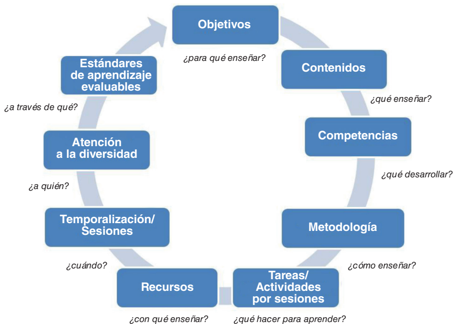
Figura 2.2. Rueda de elementos curriculares.

El profesor debe planificar bien todos estos aspectos en cada una de sus sesiones. Una buena planificación interna de todos los elementos curriculares proporciona la coherencia necesaria para facilitar una enseñanza y un aprendizaje óptimos. De hecho, se dice que el éxito del proceso de enseñanza-aprendizaje viene determinado, en la mayoría de los casos, por una buena planificación. Cada uno de estos aspectos es importante por sí mismo, pero la realidad es que, sin un objetivo claro que guíe nuestra enseñanza, el proceso no tendría sentido. De ahí la importancia de conocer siempre antes de enfrentarnos a una clase o sesión los fines u objetivos que pretendemos alcanzar.