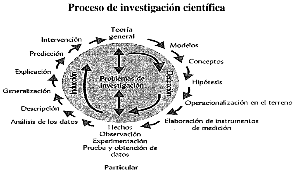
Figura 2 Elaboración propia.

La administración pública, en su proceso de investigación, puede utilizar la combinación de ambos procedimientos, según las propias circunstancias lo ameriten, y los hechos objeto de investigación lo requieran. Así, podemos describir el proceso de investigación científica con base en la figura 2.