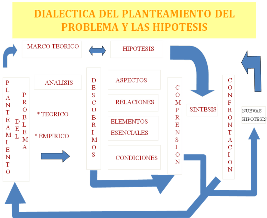
Figura 1 Elaboración propia.

Veamos ahora algunos procesos racionales de generación de conocimiento.