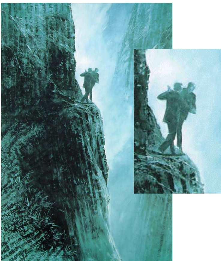
Fotomontaje de Mark Tansey. Derrida Queries de Man. Y detalle

Esta misma necesidad de integrar vivencialmente lo que se puede relacionar de la teoría con las vidas particulares es la nota característica de la influencia de la filosofía francesa en las prácticas artísticas y en las comunidades de cibernautas. A partir de los años 50, el arte experimenta, y fundamentalmente esto ocurre en América, una explosión de prácticas diversificadas en donde teoría y praxis se van diluyendo en un arte que contiene su propio discurso legitimador. Desde el expresionismo abstracto hasta el arte de la instalación y el uso de las nuevas tecnologías, en muy poco tiempo las tendencias se van sucediendo a partir de reflexiones teóricas y estéticas en donde la filosofía francesa se revela más valiosa que el pensamiento marxista o romántico anterior. El arte minimal, el conceptual, el happening, el arte pop incluso el Land Art van a tomar como biblia la obra de Baudillard. Según afirma un galerista "en dos años todo el mundo había leído Simulations "