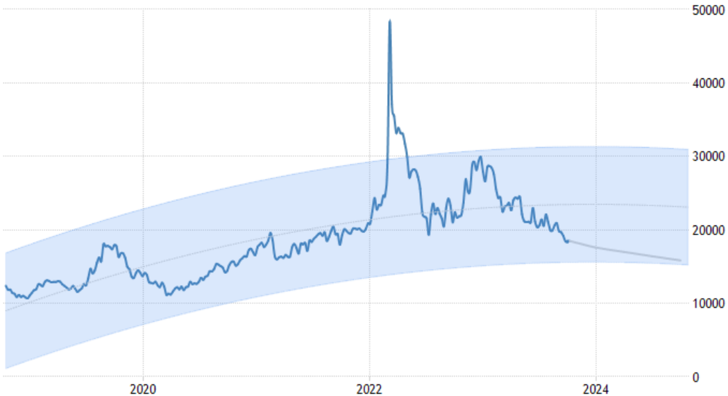
Diễn biến giá nickel và dự báo

đạt tới mức đỉnh điểm 48.560 USD/tấn vào ngày 7-3-2022, nửa tháng sau khi bùng phát xung đột vũ trang giữa Nga-Ukraine. Nhưng 9 tháng sau, giá nickel rớt xuống mức 31.280 USD/tấn (7-12-2022), mất ~55% giá trị. Tuy nhiên, dữ liệu cho thấy một đáy mới về giá hàng hóa nguyên liệu nickel được tạm thiết lập vào ngày 11-10-2023 vừa qua, ở mức chỉ còn 18.080 USD/tấn, tức chỉ còn 37% giá trị so với lúc đỉnh điểm.