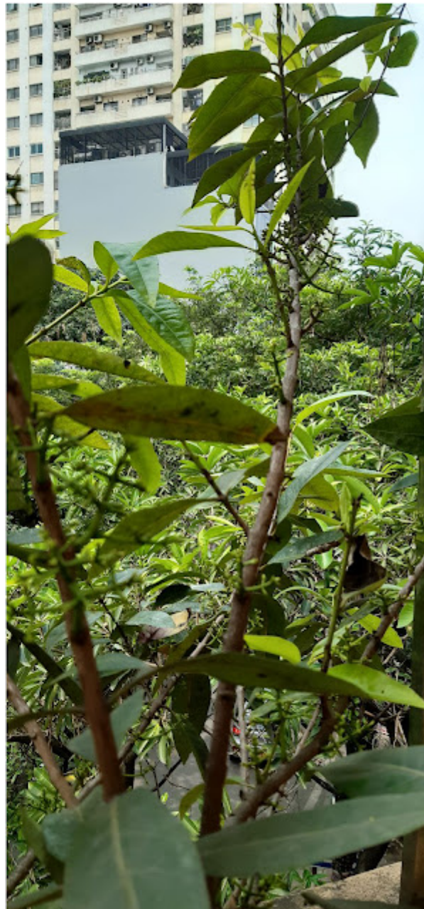
Hình : Chồi hoa vôi chi chít khắp cành.