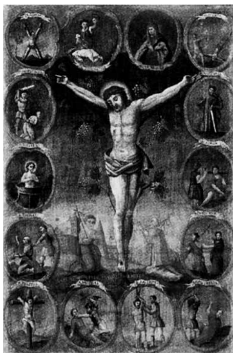
3 il. Nežinomas Lietuvos dailininkas. Nukryžiuotasis ant vynmedžio . XVIII a. Raguvėlės bažnyčia

nyčios paveiksle „Nukryžiuotasis ant vynmedžio ir apaštalų kankinytė“. (il. 3) Su kankinimo įrankiais apaštalai pavaizduoti ir Matthäuso Schmido medžio raižinyje „Nukryžiuotasis ant vynmedžio ir apaštalai“ (1653–1680), kuris saugomas Niurnbergo nacionaliniame Germanų muziejuje, ir reprodukuotame Maxo Geisbergo sudarytame kataloge The German Single-leaf Woodcut 1600–1700: a pic-