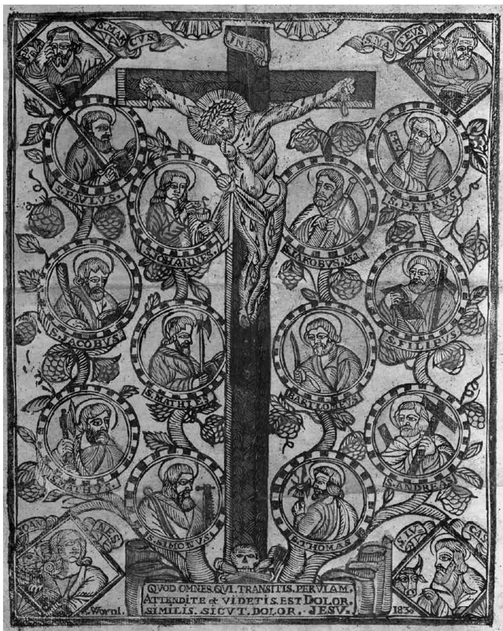
1 il. Nežinomas Lietuvos dailininkas. Nukryžiuotasis . 1830. Medžio raižinys. Fotografavo Juozas Timukas. 1938. 24 x18 cm. NČDM Ng 15300

kinimo įrankiais ir kitais būdingais atributais. Kampuose su savo atributais pa-vaizduoti keturi evangelistai, kurie kompozicijoje atlieka Jėzaus istorijos liudinin-čių ir metraštininkų vaidmenį. Po lemtin-