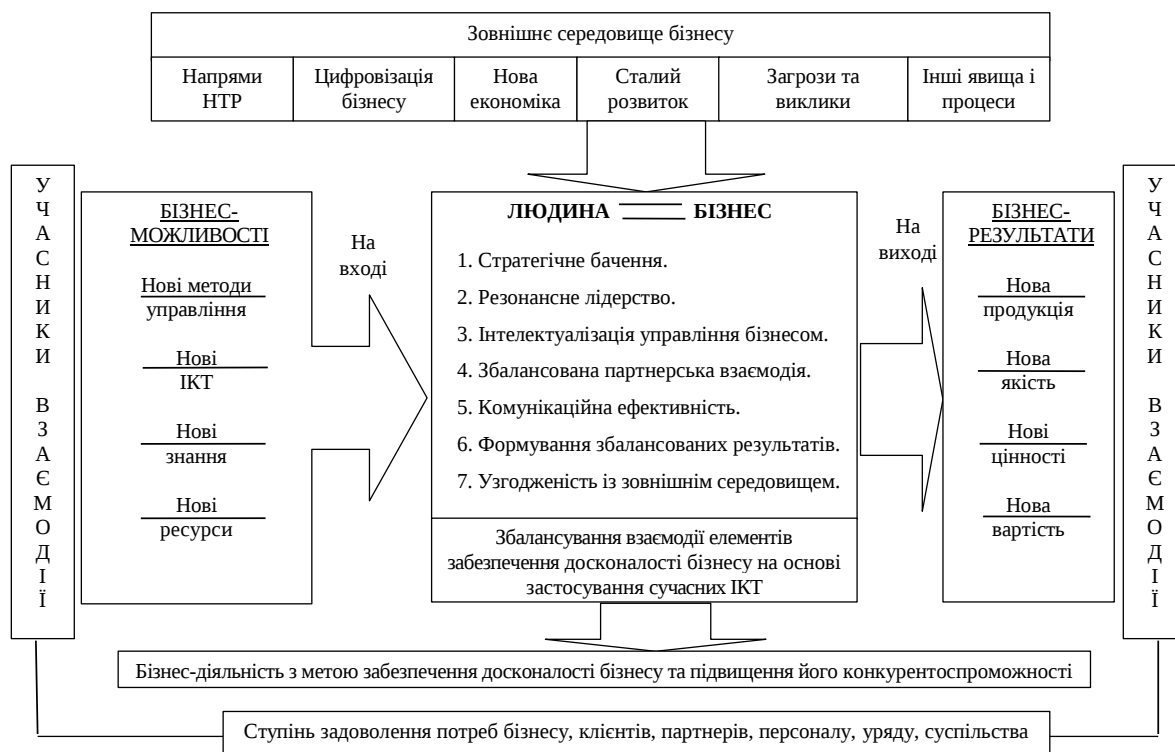
Рис. 2. Економічна модель забезпечення досконалості бізнесу промислових підприємств України (авторська розробка)

Баланс взаємодії елементів, що забезпечують формування досконалого бізнесу, заснованого на застосуванні сучасних ІКТ для промислових підприємств, дозволить створити таку систему цінностей, яка буде здатна налагодити якісно нову взаємодію між бізнесом, клієнтами, партнерами, персоналом, урядом тощо, маючи на меті досягнення та забезпечення їх спільної ефективної взаємодії (рис. 2).