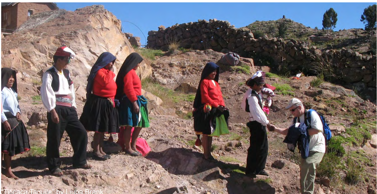
Titicaca, Taquile