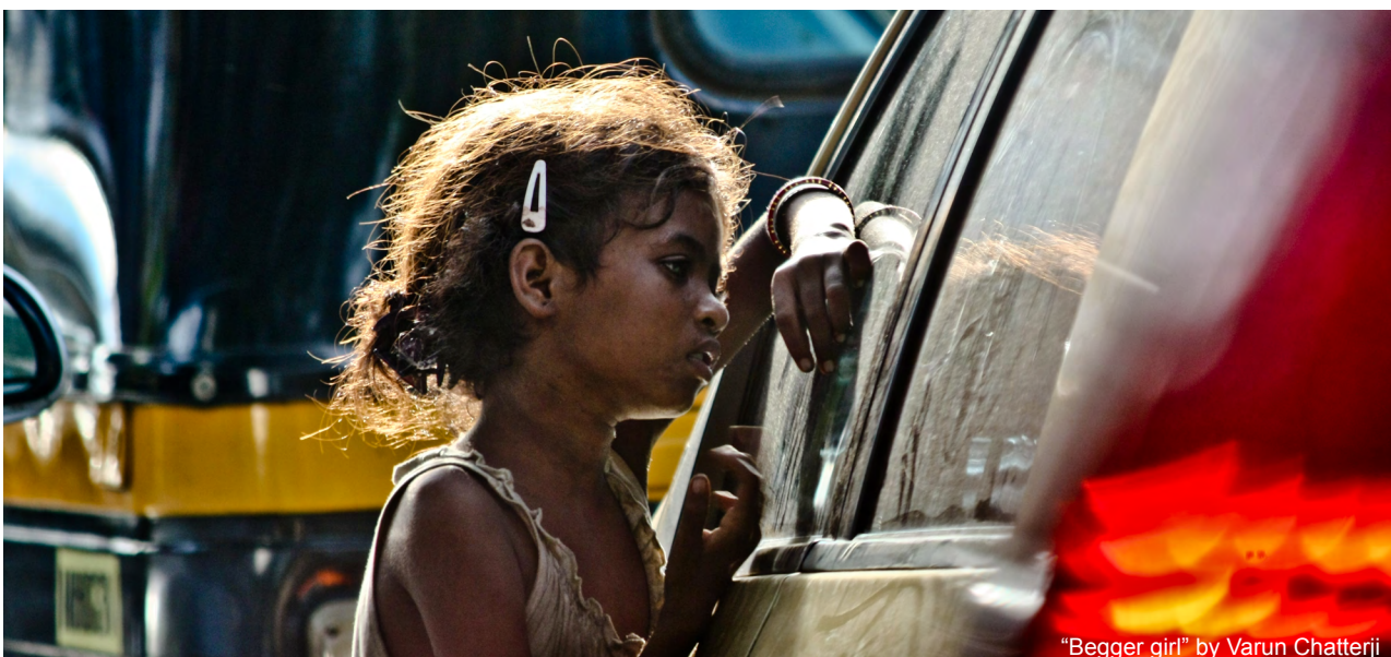
“Begger girl” by Varun Chatterji

Wie Thomas Pogge verdeutlicht, hat sich dieses Ungleichgewicht bereits strukturell gefestigt: Die von den Grossmächten und ihren Interessen geprägte Weltordnung in Form des internationalen Rechts trägt eine grosse Mitschuld an der wachsenden Kluft zwischen Arm und Reich sowie der anhaltenden globalen Armut. Als herausragendes Beispiel nennt Pogge das internationale Rohstoffprivileg, welches Privatkonzernen einräumt, Eigentum an Naturressourcen eines Landes zu kaufen, welche somit ertragslos an der lokalen Bevölkerung vorbeigeschleust werden. (54)