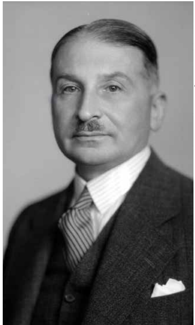
Ludwig von Mises, 1881-1973

Statt an der Universität machte Mises in der Handelskammer Karriere. Er startete 1910 als „Konzeptpraktikant“ und arbeitete sich bis zum leitenden Sekretär hoch. Wie groß sein Einfluss auf die Wirtschaftspolitik der Ersten Republik tatsächlich war, ist Gegenstand aktueller historischer Forschung. Jedenfalls wurde Mises von der Notenbank, von Ministerien und natürlich vom Präsidium der Handelskammer immer wieder als Berater beigezogen. Weil Mises, wie Hayek beschreibt, ein normales Tagespensum in zwei Stunden Arbeit erledigen konnte, publizierte Mises weiterhin sowohl wissenschaftlich als auch in