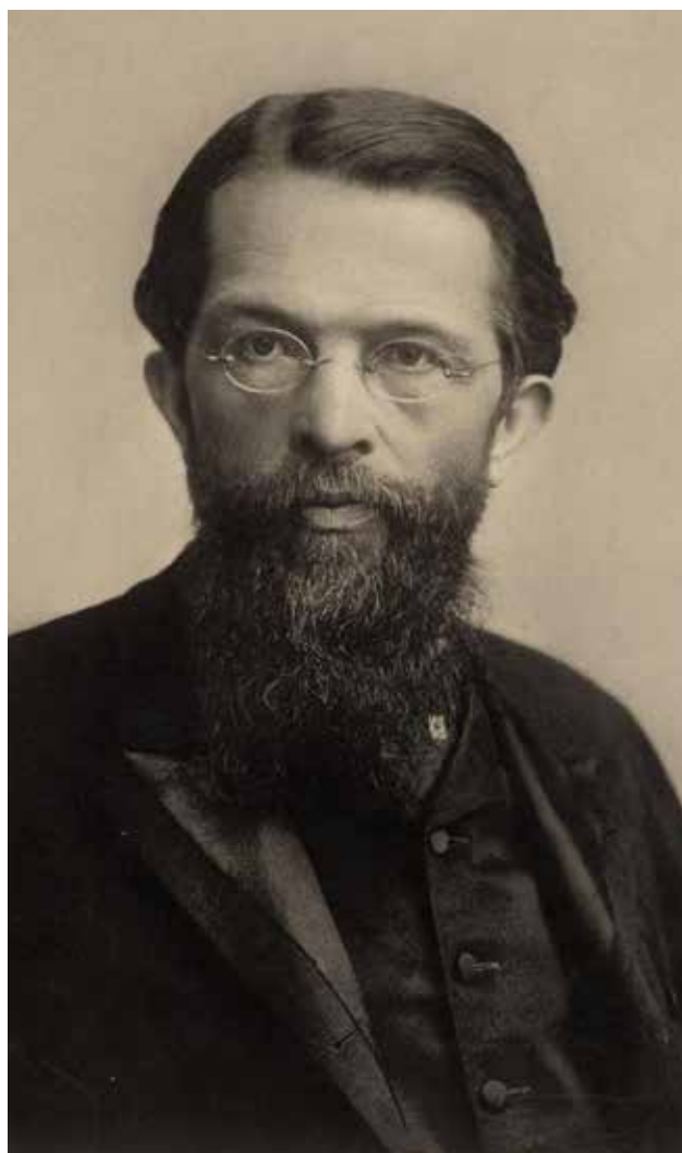
Karl (Carl) Menger, 1840-1921

Das Geburtsjahr dieser Denkrichtung wird meist mit 1871 datiert, als Carl Menger die Grundsätze der Volkswirtschaftslehre publizierte. Darin verbesserte er bestehende Theorien (weitgehend) subjektiver Bewertungen und erklärte soziale Phänomene wie Tausch, Preise und Geld als das unintendierte Resultat des Zusammenspiels intendierter menschlicher Handlungen. Menger zeigte, dass Geld ohne Planung und Staatsgewalt entstehen kann – weshalb sich 150 Jahre später unter anderem Verfechter von Kryptowährungen auf ihn berufen, manchmal mit der überzogenen Behauptung, Geld müsse ungeplant und ohne Staat entstehen. Jedenfalls bleibt Mengers innovative Kombination von Subjektivismus mit methodologischem Individualismus trotz diverser Variationen und interner Richtungsstreitigkeiten bis heute ein Eckpfeiler der Österreichischen Schule.