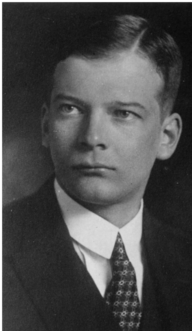
Gottfried Haberler, 1900-1995

Daten die Basis menschlichen Handelns sind, sondern auch eine subjektive Interpretation der Situation und der Daten. Individuen handeln auf Basis ihres subjektiven Wissens; möglicherweise finden sie durch Misserfolge heraus, dass ihre Annahmen falsch waren.