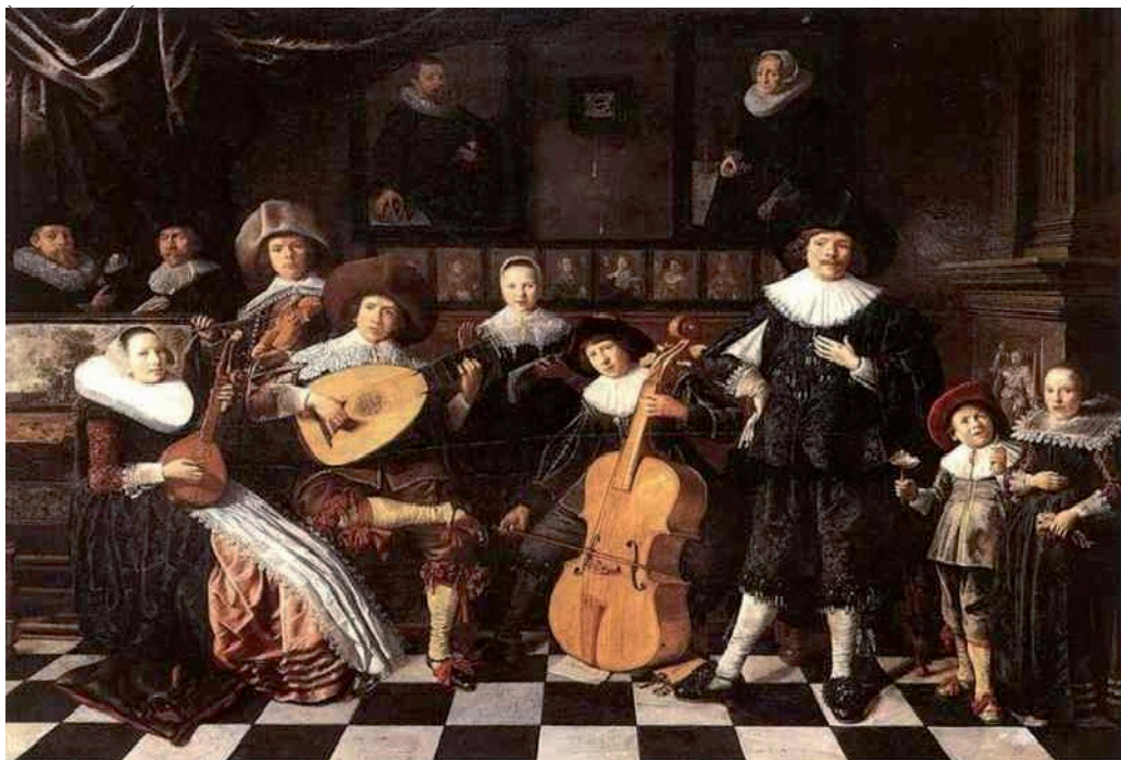
Рис. 2. Иллюстрация эпохи позднего Возрождения (XVI в.)

Теперь сопоставьте эту картину с сегодняшней зарисовкой жизни обычной семьи технообщества (рис. 3).