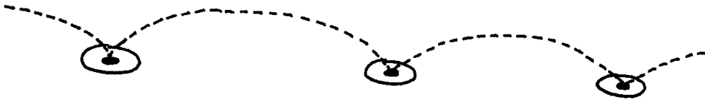
Rys. 2 Łańcuch łączący uprzednio zdeterminowane cele (= trail-following ); reprodukcja ze s. 101.

Nakreślona przez Ingolda tuż po przytoczonym wyżej akapicie linia spełnia wszystkie warunki owego dynamicznego śladu ruchu, który od początku do końca książki konsekwentnie usiłuje on powiązać z fenomenem swobodnej, niczym uprzednio niezdeteminowanej wędrówki – a zatem w prosty, a zarazem jakże czytelny zarazem sposób pokazuje ona, jak zataczanie niespiesznych kręgów w przestrzeni sprzyja mapowaniu rizomatycznej sieci miejsc. Tak rozumiane miejscotwórstwo ( place-making ) nie ma, co istotne, nic wspólnego z turystycznymi symulakrami przepełniającymi ilustrowane mapy, wirtualne aplikacje i przewodniki, których funkcjonalność sprawia, że nad żywym doświadczeniem poznawania obcego świata coraz częściej przeważa poszukiwanie uprzednio zapoznanych punktów orientacyjnych ( landmarks ) czy też synchronizowanie ciekawych miejsc z ich otagowanymi odpowiednikami w sieci ( points of interest ).