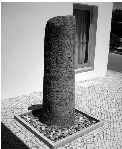
Fig.9 - O marco miliário da milha XI da via Ebora-Pax Iulia (Porto da Calçadinha / Camoeira).