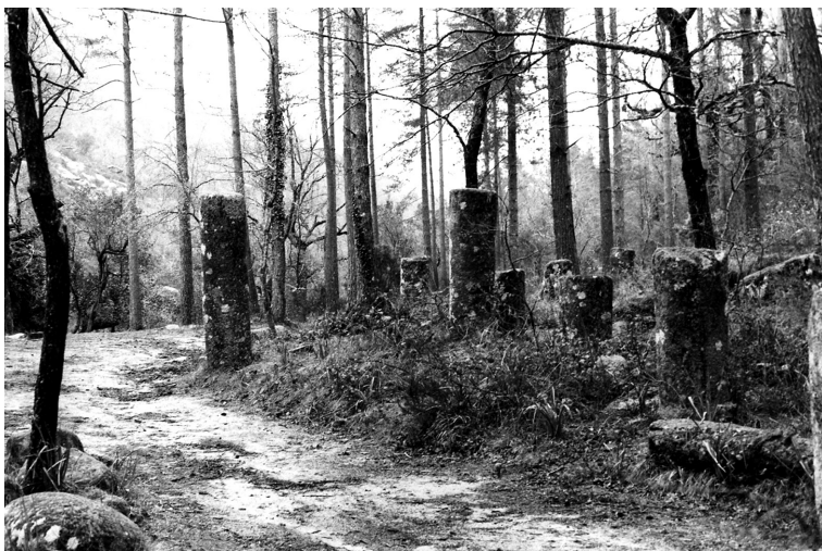
Fig.7 - Ninho de miliários da Via Nova entre Bracara e Asturica , na Portela do Homem.

4682 Salmanticae, 'en la casa del conde de Fuentes' Dáv. Postea en el puente sobre Tormes' Ponz. Nescio num adhuc extet.