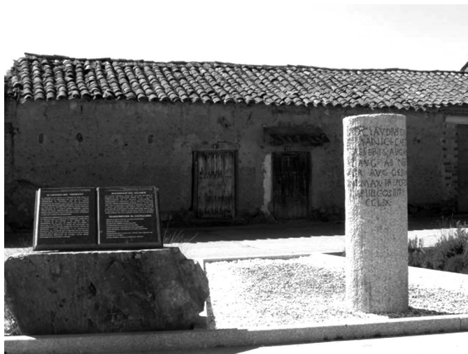
Fig.11 - Cópia do miliário de Miles da la Polvorosa, da via Emerita-Asturica , com painéis explicativos, levantado no local de achado do monumento.