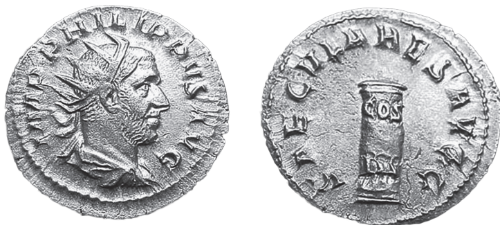
Fig.1 - Antoniniano de Filipe, o Árabe, comemorativo dos festejos do milenário de Roma.