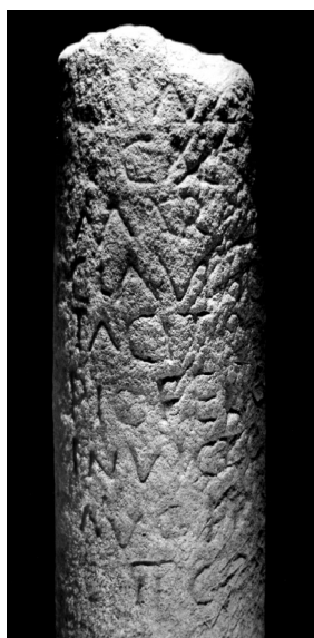
Fig.10 - Miliário de Tácito, recolhido por Mário Saa na Nossa Senhora dos Prazeres.