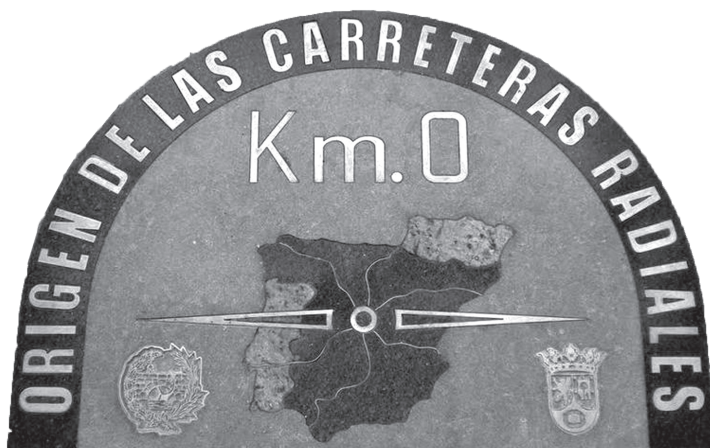
Fig.2 - Ponto de contagem inicial das distâncias das estradas radiais, Madrid.