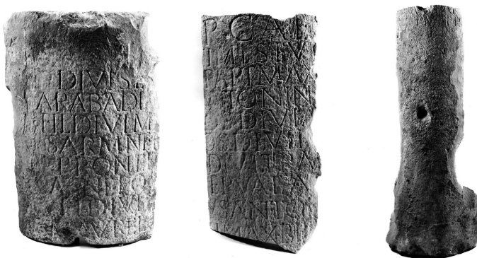
Fig.5 - Miliário de Caracala, quebrado para reutilização, achado em Soure.