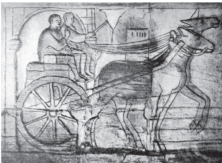
Fig.4 - Baixo relevo do monumento funerário de Igel.