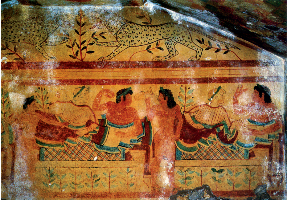
Tumba de los Leopardos. Pintura mural, siglo v a.C.