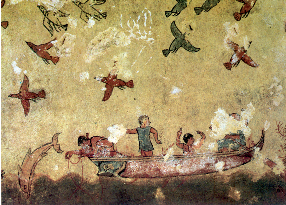
Tumba de la Caza y de la Pesca. Pintura mural, siglo v a.C.