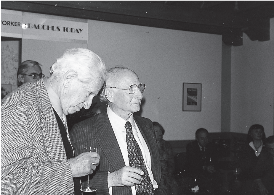
Herbert Marcuse y Leo Löwenthal a finales de 1977.

siempre que las denominadas naciones cristianas han entrado en conflicto con otras culturas. En el siglo XVI el primer obispo de Méjico quema la literatura azteca, y una generación después, un delegado de ese obispo condenó la literatura maya a fenecer en el fuego 20 . El cardenal Ximénez, el adversario del moro Almansor en la tragedia de Heine, de donde tomo la cita «donde se queman libros acaba también por quemarse también a los individuos», tras la derrota de los árabes en torno al 1500 procede a la eliminación de la cultura mora haciendo quemar en la plaza pública de Vivarramba más de un millón de libros 21 . De manera periódica, la Inquisición continuará con acciones de este tipo.