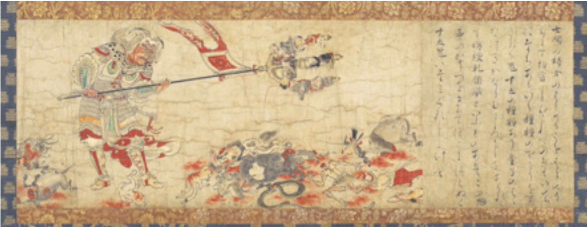
Fig. 4: Extermination of Evil: Sendan Kendatsuba (siglo XII)