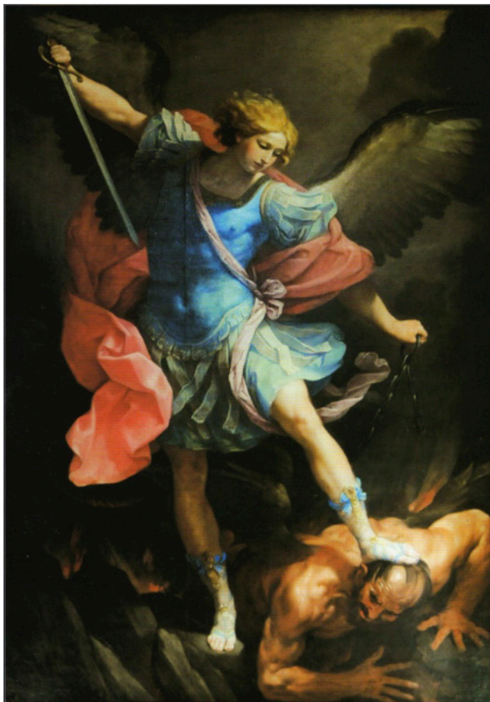
Fig. 1: Guido Reni, San Miguel y el diablo (1636)