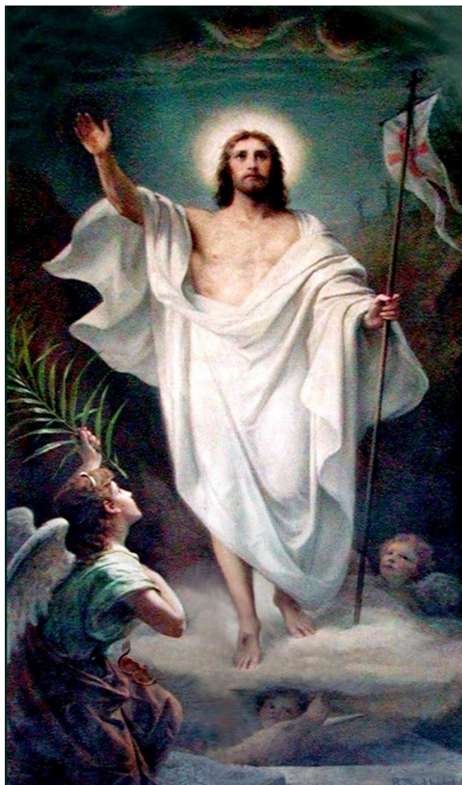
Victorie asupra mormântului, de Bernard Plockhorst

Noul Testament leagă Cina cea de taină și crucificarea lui Iisus de Paștele evreiesc și exodul din Egipt. Iisus s-a pregătit pe el însuși și pe discipolii săi pentru moartea sa în timpul Cinei, dând mesei de Paștele evreiesc un nou înțeles. El a identificat pâinea și cupa de vin ca