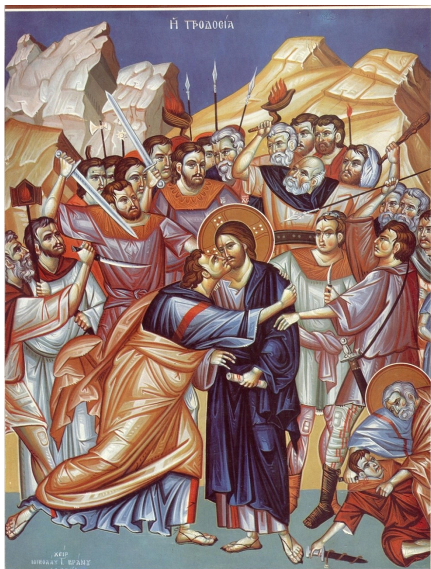
Icoană - Vinderea

Anicet nu au încercat să convingă pe ceilalți, dar nu au luat în considerare problema schismatică, despărțind-se în pace și lăsând întrebarea nesoluționată.