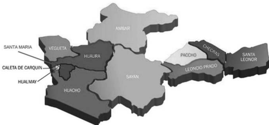
Figura 1. Provincia de Huaura. Norte del departamento de Lima.

La economía de Huacho se basa en su agricultura, ganadería e industria. Al pasear por el malecón y por la playa se puede degustar uno de los mejores cebiches, preparado con peje sapo. Los mariscos de la zona, son reconocidos y valorados gracias al testimonio de los visitantes.