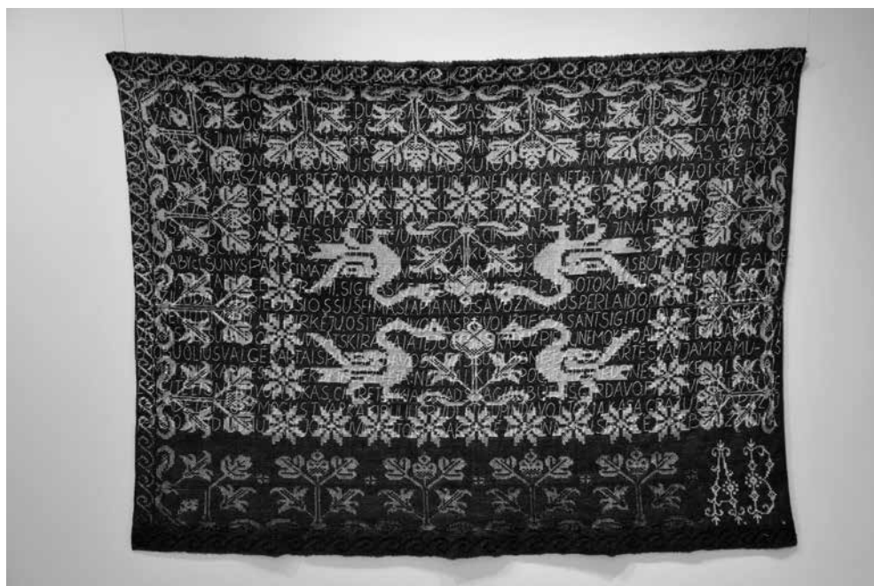
J. PETRUŠKEVIČIENĖ. Dzūkiška istorija , 2013. Sena lovatiesė, metalizuoti siūlai, siuvinėjimas, 140 × 190