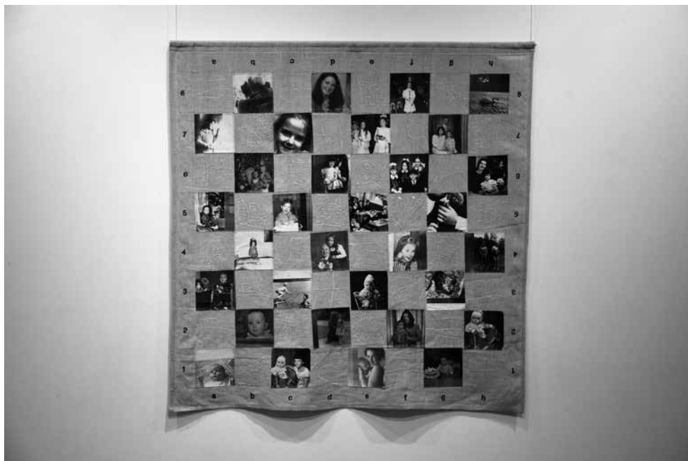
J. PETRUŠKEVIČIENĖ. Žaidimas su laiku , 2003. Linas, foto ant audinio, siuvinėjimas mašina, 100 × 100