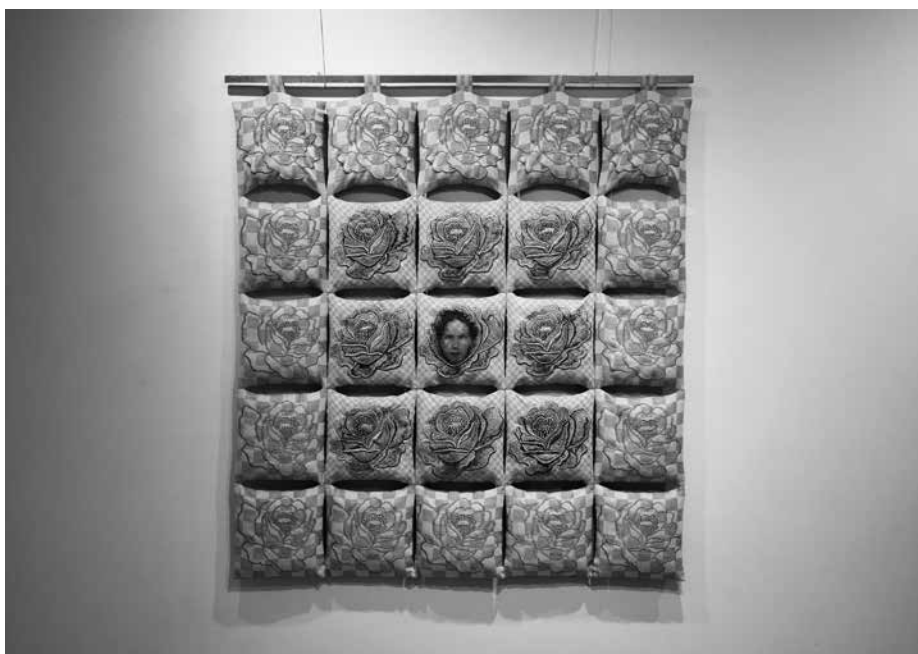
J. PETRUŠKEVIČIENĖ. Nepažintai močiutei Grasildai , 2003. Linas, metalizuoti siūlai, foto ant audinio, siuvinėjimas mašina ir rankomis, 118 × 114 × 4