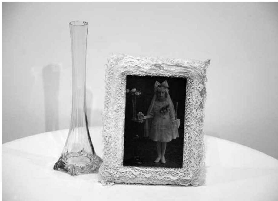
J. PETRUŠKEVIČIENĖ. Baltoji diena , 2002. Mezginiai, medvilnė, foto ant audinio, siuvimas, vazelė (25 cm), 21 × 16