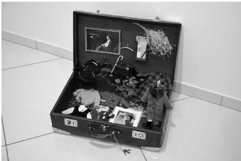
J. PETRUŠKEVIČIENĖ. Emilijos pasaulis , 2011. Siūlai, oda, medis, siuvimas, mezgimas, siuvinėjimas, drožimas, klijavimas, 22 mini darbai iki 18 cm aukščio