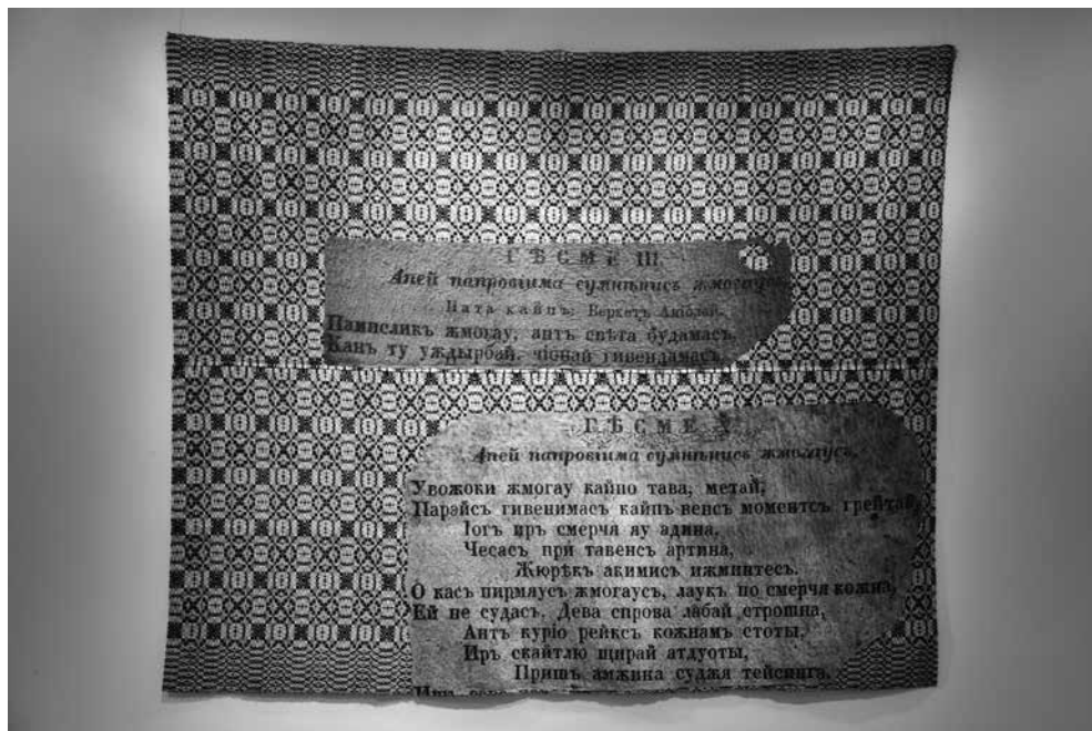
J. PETRUŠKEVIČIENĖ. Lietuviškos spaudos draudimas (graždanka) , 2010. Sena lovatiesė, poliesteris, skaitmeninė spauda, siuvinėjimas, aplikacija, 145 × 180