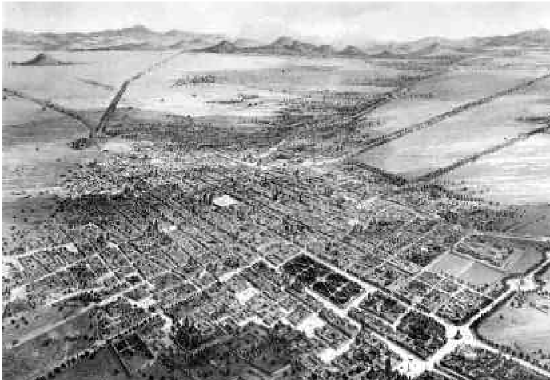
Figura 1. Vista de la ciudad de México desde un globo. Famosa litografía de C. Castro donde se aprecia rectángulo con el trazado en diagonal que conformaba la Alameda colonial y su relación con el Paseo Nuevo o de Bucarelli.