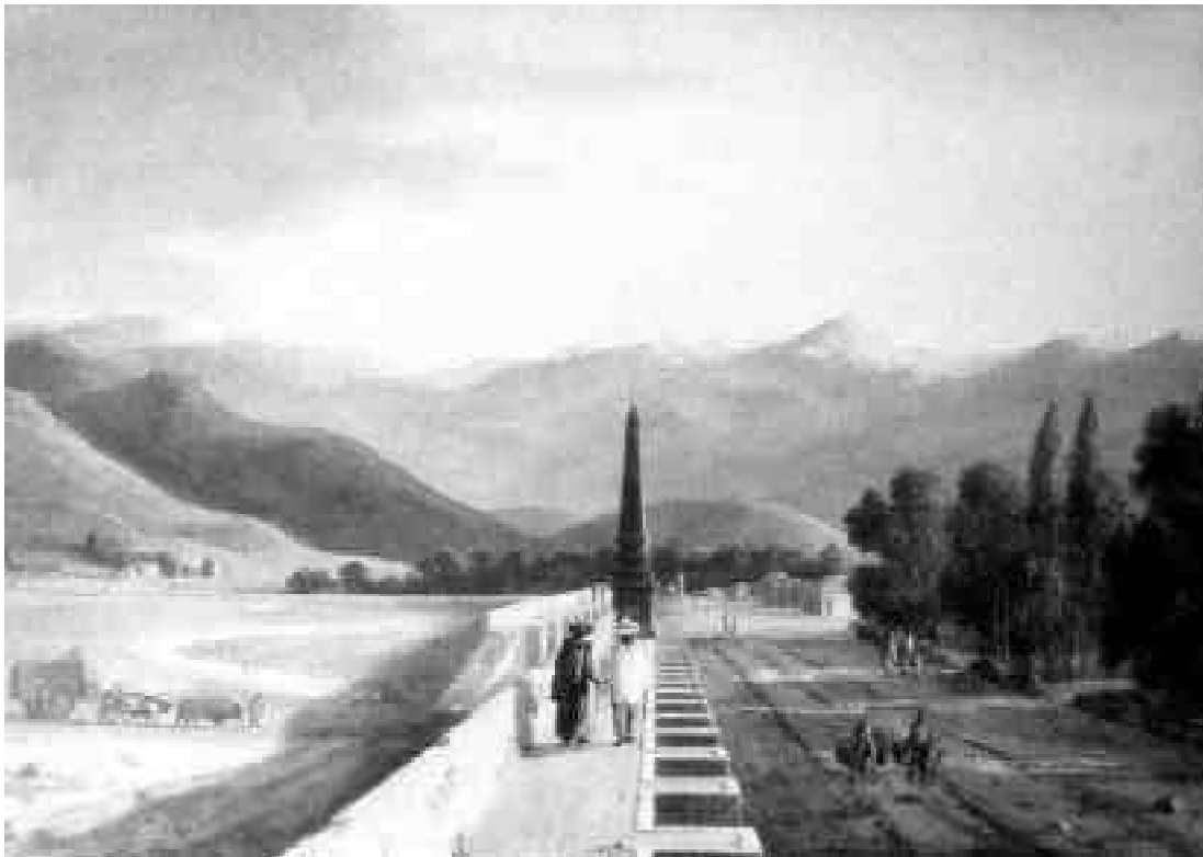
Figura 7. Paseo del Tajamar. Oleo de Carlos Wood. Siglo XIX (Museo Histórico Nacional de Santiago).

una hilera de árboles en medio del espacio destinado a paseo; pero, por su importancia como referencia urbana, La Cañada o Alameda de Santiago fue citada en todos los planos de Santiago, incluso los más esquemáticos, como el de Antonio Lozada, fechado entre 1755 y 1761, que representa el Llano de Maipo donde las únicas referencias de Santiago son el río Mapocho, el cerro Santa Lucía y La Cañada.