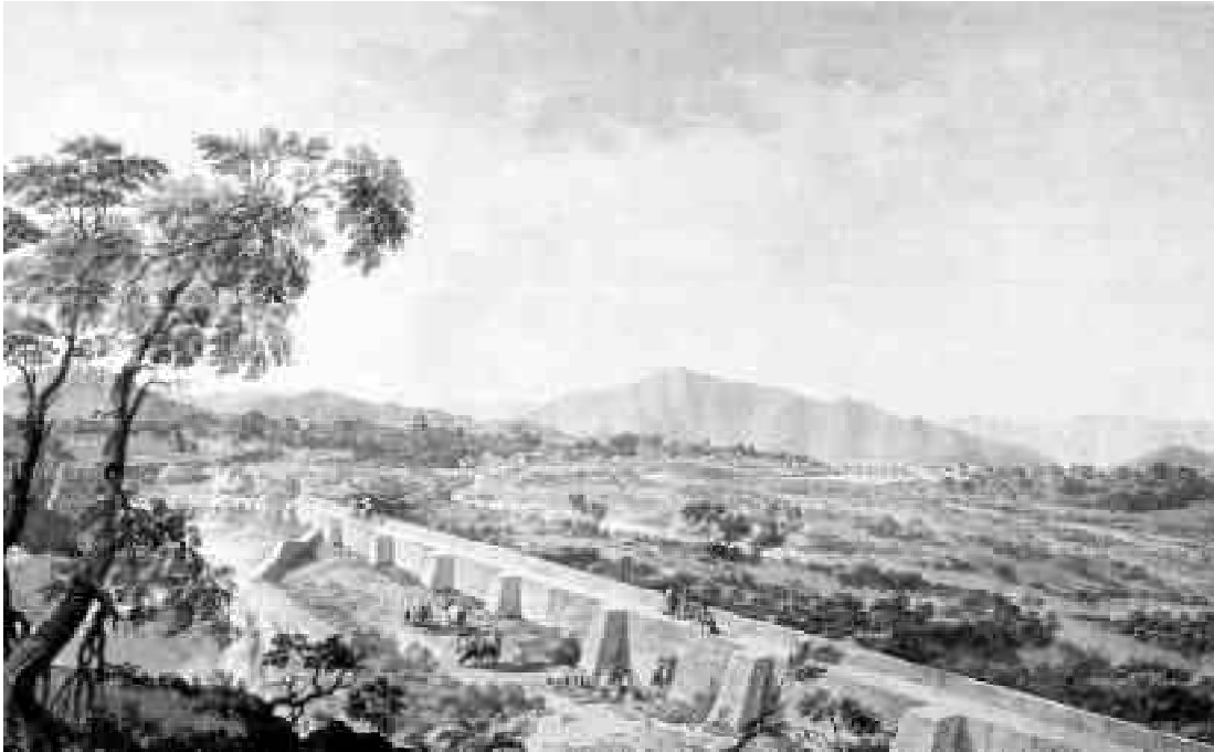
Figura 8. Vista de Santiago con los tajamares del Mapocho. Aguada de Fernando Brambilla