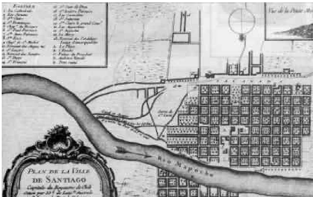
Figura 6. Copia del plano de la ciudad de Santiago de Amadeo Freziér.