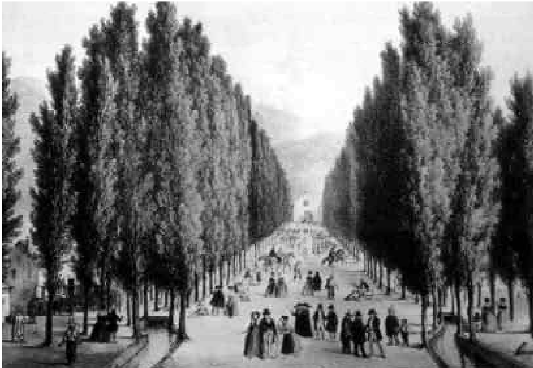
Figura 5. El paseo de La Cañada. Litografía de Lehnert, basada en un dibujo de Van der Burch que forma parte del Atlas de Claude Gay.