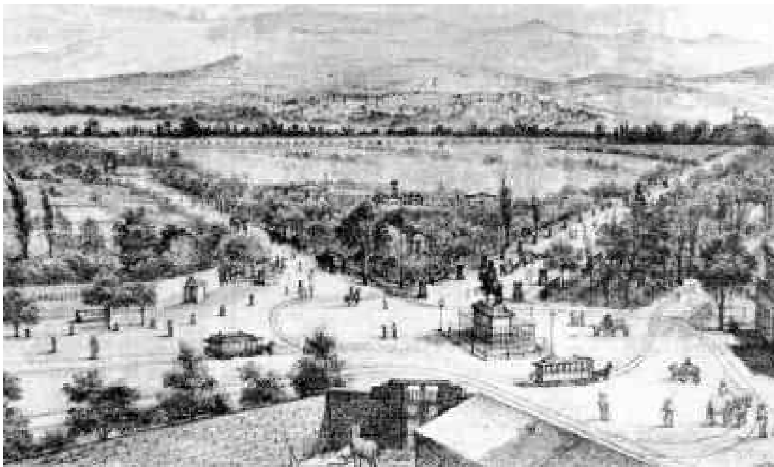
Figura 2. Litografía de Ciudad de México con el Paseo de Bucarelli.