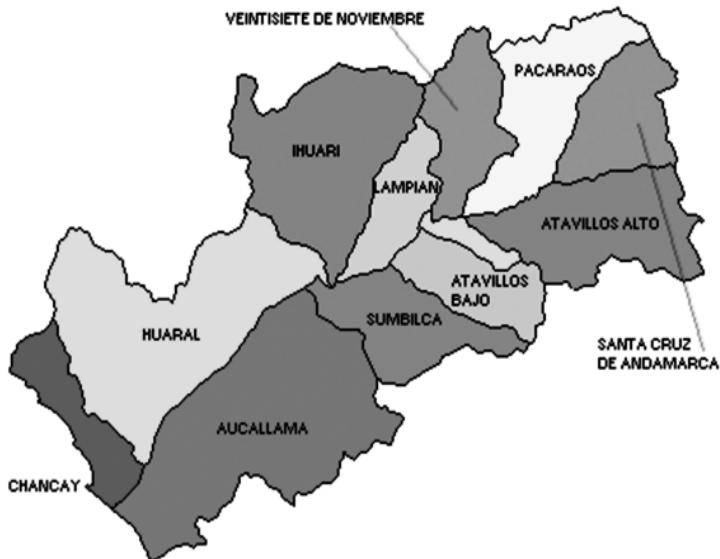
Figura 3. Baños termales de La Collpa, Santa Catalina (Rojas, 2018).

El segmento de mercado que llega a los baños termales de La Collpa básicamente es familiar y juvenil, que llegan en mayor número los fines de semana, atraídos por la motivación de salud, relax y esparcimiento, esto sucede de manera espontánea, pues no se realizan campañas de difusión del atractivo.