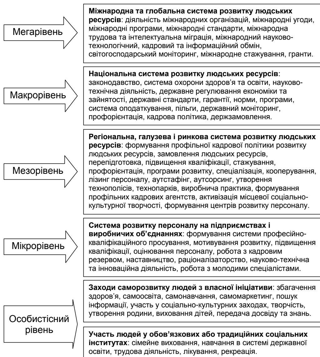
Рис. 1. Система управління розвитком людських ресурсів у світовому господарстві

Викладення основного матеріалу дослідження. Розвиток людських ресурсів може мати як позитивні так і негативні ознаки та наслідки для суспільства (у виробництві, економіці, екології, культурі). Відповідно управлінські зусилля треба спрямовувати на позитивний та корисний для суспільства розвиток людських ресурсів (конструктивний, прогресивний, результативний, ефективний, стійкий, сталий, гармонійний, збалансований). Проте цей напрям управлінської діяльності буде відбуватися лише при свідомому якісному керуванні заходами у сфері розвитку людських ресурсів на ґрунтовно розробленій науковій основі. Сучасна існуюча система управління розвитком людських ресурсів у світовому господарстві реалізується на різних управлінських рівнях суспільними інститутами які здійснюють збагачення людського капіталу (рис. 1).