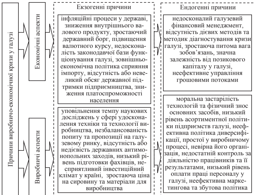
Рис. 2.3. Причини виробничо-економічної кризи у галузі

Зобразимо наведені дослідження на рис. 2.3.