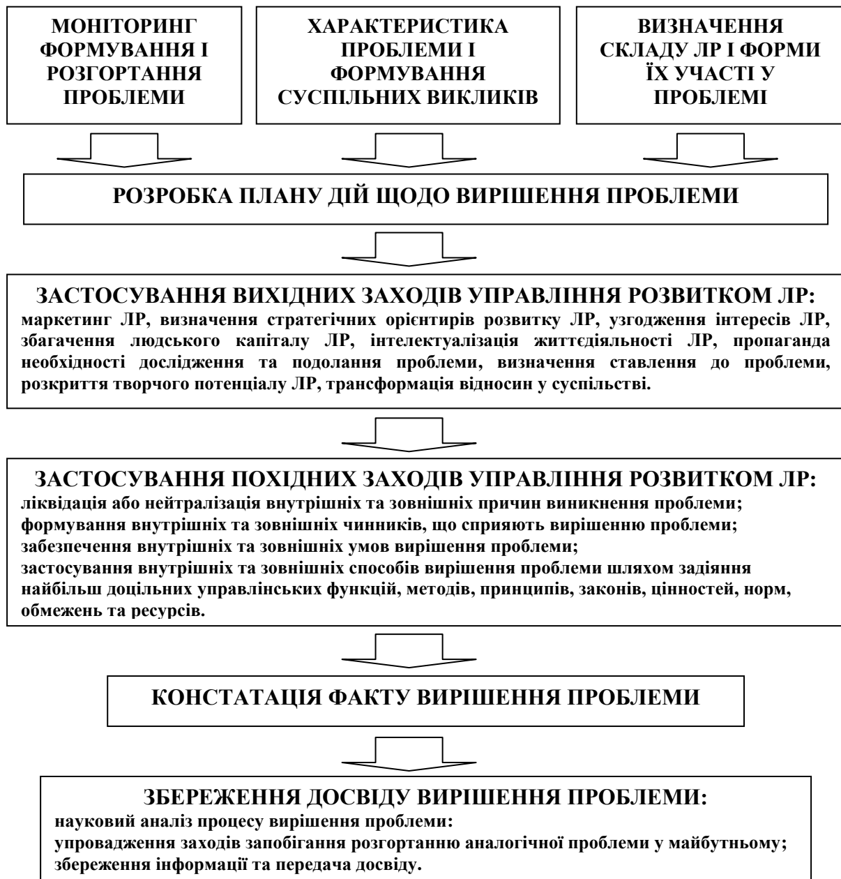
Рис. 3. Схема господарського механізму вирішення суспільної проблеми шляхом управління розвитком ЛР

інтереси, різне бачення, небажання іти на поступки тощо), а заходи щодо вирішення проблем часто неефективні, недовговічні та зустрічають опір через їх примусовий характер. Соціальність суспільних проблем обумовлює необхідність побудови господарського механізму їх вирішення в основі якого повинні стати заходи управління розвитком ЛР. Так на рис. 3 нами пропонується наступний алгоритм подолання суспільної проблеми.