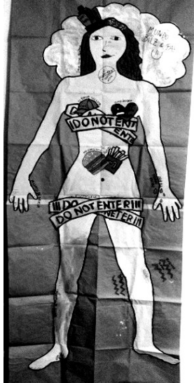
FIGURA 3. PROPUESTA DE MAPA CORPORAL

Esta fase se puede iniciar con una consigna del tipo: Dibujaremos símbolos, palabras o mensajes que representen tu cuerpo y las experiencias que tú decidas trabajar.