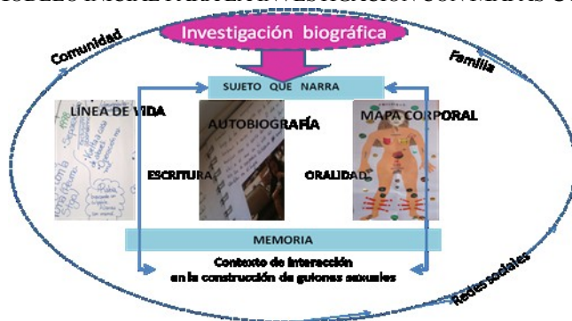
FIGURA 1. MODELO INICIAL PARA LA INVESTIGACIÓN CON MAPAS CORPORALES

A diferencia de lo anterior, con el modelo propuesto de mapas corporales en la investigación biográfica no se busca favorecer un proceso diagnóstico ni de intervención, por el contrario, se estimula la emergencia de significados y discursos encarnados en un cuerpo protagonista de la biografía del sujeto. Sus procedimientos buscan articular saberes en una co-construcción de escritura, relato oral y gráfica autobiográfica con las que se elabora una geografía de la experiencia corporal a partir de relaciones interpersonales con figuras significativas y autoanálisis de experiencias que emergen desde los niveles intrapsíquicos entramados con escenarios socioculturales y afectivos donde ocurrieron los eventos seleccionados. La relación que se produce entre el sujeto que produce el mapa corporal con el investigador es dialógica, de manera que se reconoce en quien elabora el mapa corporal la noción de autoría, destacando la agencia y autonomía del sujeto en la producción de saber y verdad. El proceso antes descrito puede resumirse en el siguiente esquema: