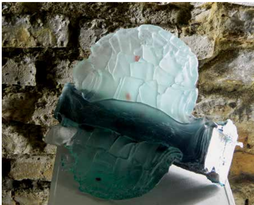
Artūras RIMKEVIČIUS. Koralų rifas . 2012