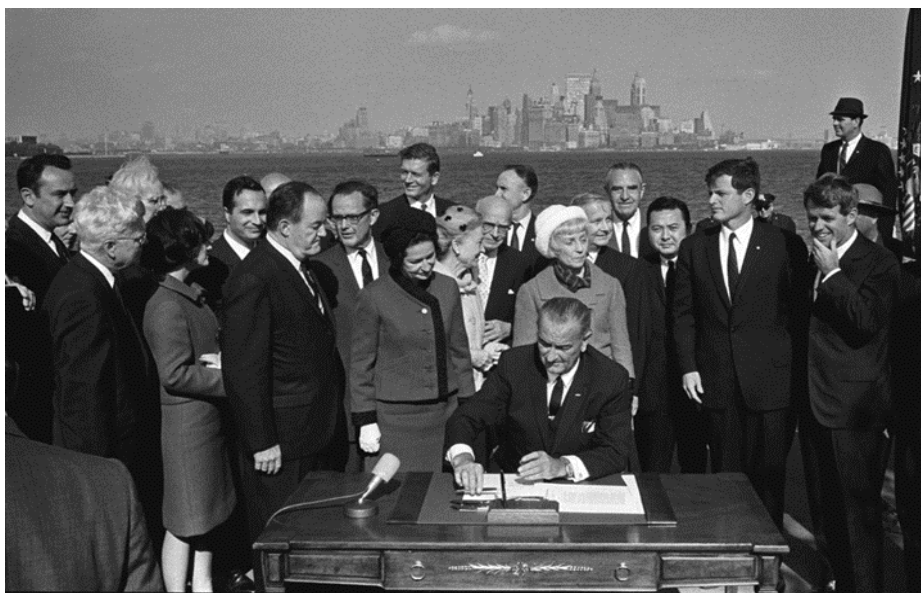
Самый печальный день в истории США. Президент Джонсон, с 2 Кеннеди и экс-президент Гувер, дает Америке в Мексику - 3 октября 1965

для того, чтобы вывести значительную часть бедного населения из нищеты и удержать их там. Попытка сделать это обанкротила Америку и разрушила мир. Способность Земли производить пищу уменьшается с каждым днем, как и наше генетическое качество. И теперь, как всегда, самым большим врагом бедных являются другие бедные, а не богатые. Без драматических и немедленных изменений нет надежды на предотвращение распада Америки или любой страны, которая следует демократической системе.