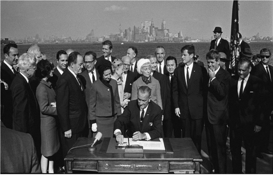
美国历史上最悲伤的一天。约翰逊总统，与两个肯尼迪和前总统胡佛，把美国给墨西哥 - 1965年10月3日