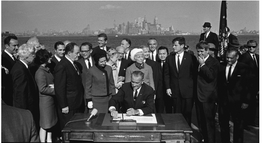
El día más triste de la historia de Estados Unidos. El presidente Johnson, con dos Kennedys y el expresidente Hoover, da a Estados Unidos a México - 3 de octubre de 1965