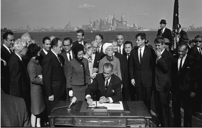
O dia mais triste da história dos EUA. Presidente Johnson, com dos Kennedys e ex-Presidente Hoover, dá América para o México-3 de outubro de 1965