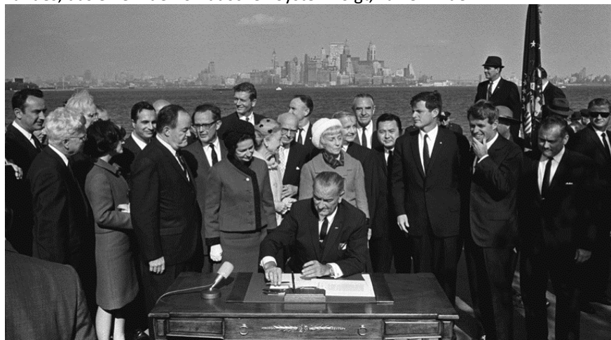
Der traurigste Tag in der US-Geschichte. Präsident Johnson, mit 2 Kennedys und Ex-Präsident Hoover, gibt Amerika an Mexiko - 3. Oktober 1965