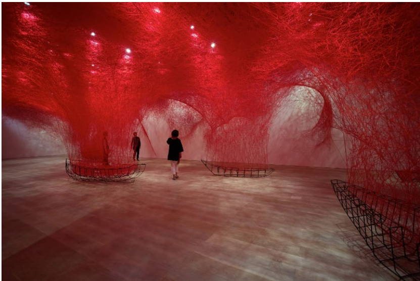
Fig. 5: Chiharu Shiota, Uncertain Journey . Estructura de metal, lana roja, 2019. Exposición individual The Soul Trembles , en Mori Art Museum, Tokio, Japón. Fotografía de Sunhi Mang. Cortesía del Mori Art Museum de Tokio. © Chiharu Shiota. https://www.chiharu-shiota.com/uncertain-journey-1

en piezas como Uncertain journey (2019), Passage (2021) o I hope... (2021), entre otras muchas, donde estas pateras se presentan como esqueletos, sombras, sueños, restos de naufragios rodeados de hilos, asumiendo así la artista alguna de las temáticas más redundantes de finales del siglo XX y principios del XXI: la migración, con la que entra en “cuestiones como alteridad, raza, pero también desplazamiento, exilio, diáspora, extranjería o transculturalidad” (103) que Hernández defiende que se han convertido en elementos centrales de la reflexión artística contemporánea, explorando estas temáticas tan metafóricas como un lugar desde el que producir conocimiento en torno a lo social. Su discurso, no obstante, vuelve a inducir a la reflexión, no se recrea en el drama de un modo obscuro, sino que son instalaciones llenas de poesía, fuerza e impacto que, directamente sobrecogen a los espectadores colocándolos, casi irremediabilmente, en un estado de duda ante el progreso, ante lo que somos.