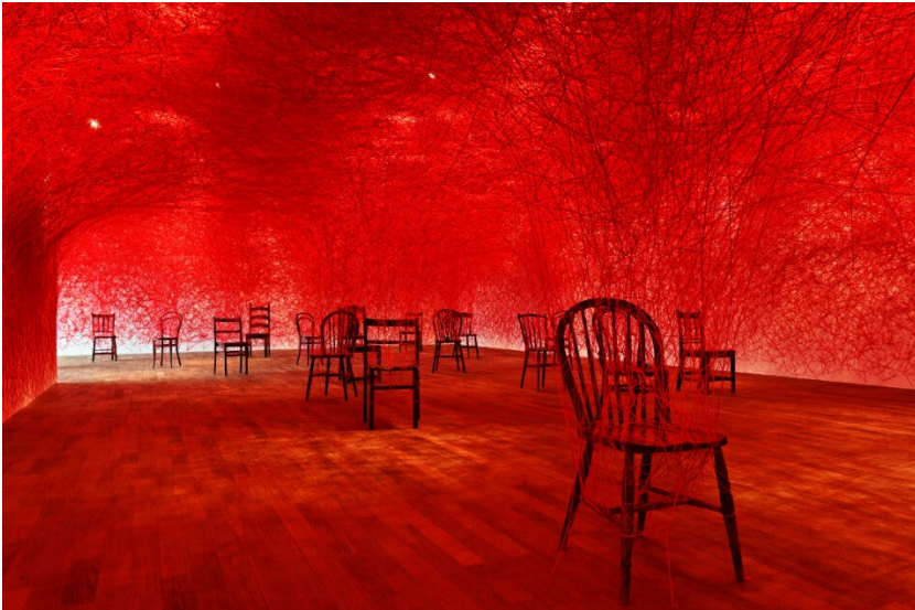
Fig. 4: Chiharu Shiota, Between us , lana roja y sillas. 2020. Expuesta en Gana Art Center/ Gana Art Nineone, Seúl, Corea del Sur. Fotografía de Lee Dongyeop. © Chiharu Shiota. https://www.chiharu-shiota.com/between-us

que nos remiten a las eternas preguntas del ser humano. Apariencia o realidad. Vemos y no vemos, quizás no queramos ver o simplemente sólo vemos lo que nos interesa ver. (Soler 2012 16)