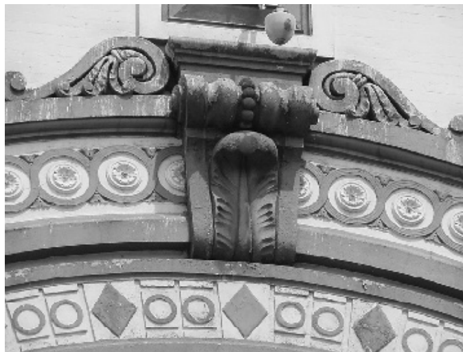
El Faenza fue diseñado por los arquitectos Arturo Tapias y Jorge Muñoz.

El mismo tipo de selección se puede encontrar en los grupos de chat y en las listas de servidores de Internet. Gente que piensa de manera similar comparte información e ideas, reforzando opiniones que ya sostenían previamente. En Internet, así como en los escenarios políticos cara a cara, la gente normalmente se encuentra incómo-