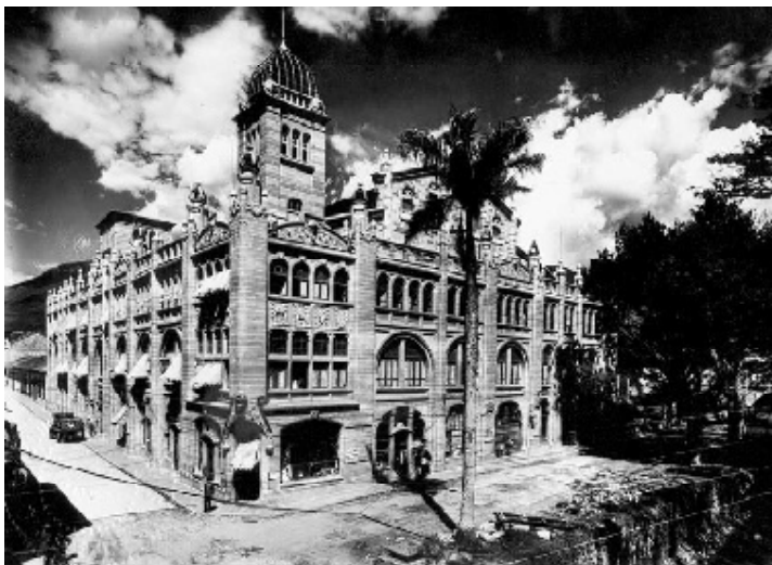
Fachada del Teatro Junín (esquina de la Playa con Junín), Medellín, 1935.

La fuerte asociación establecida entre el progreso técnico y la vitalidad de la ciudadanía continuó a lo largo del siglo XIX. Una revista de negocios de 1841 elogiaba la “navegación a vapor” y otros inventos, por el modo en que estos elevaban las capacidades políticas de los pueblos corrientes: “En exacta proporción a la extensión de la libertad política y la difusión de la inteligencia popular, se ha producido el avance de la invención y los artefactos útiles... Así como el poder político ha sido difundido entre grandes masas de hombres, la mente humana ha sido dirigida hacia aquellas invenciones que se diseñan para otorgar sólidos beneficios a esas masas” 2 . Las proclamas sobre el progreso tecnológico durante este período enfatizan comúnmente la contribución que estos progresos hacen a la igualdad política, la competencia cívica, y a la ampliación de los horizontes de la participación democrática. En 1836, George S. White, un defensor incondicional de la industrialización, alababa las continuas mejoras técnicas describiéndolas como “una máquina moral la cual, en la misma propor-