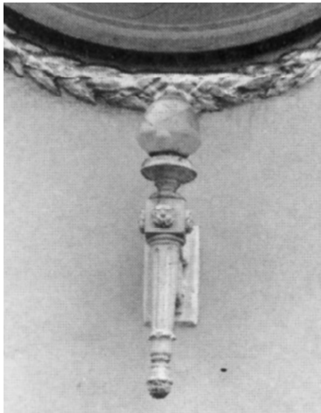
La ejecución del Teatro Faenza se encargó al ingeniero Ernesto González.

están directamente involucradas en la política o en los gobiernos. La inmensa mayoría sencillamente no están comprometidos de ningún modo con los asuntos públicos más importantes de la actualidad, y ni si quiera hablan con personas que sí lo están.