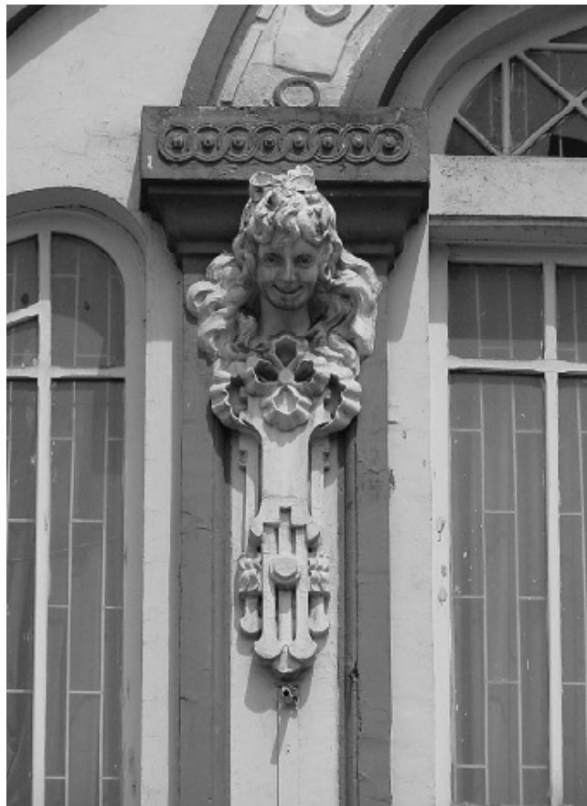
El Faenza es uno de los edificios bogotanos con influencia Art Nouveau.

Una cuestión clave es, entonces, si nuestra sociedad tiene de facto la voluntad y el compromiso necesarios para preservar un amplio dominio cultural, un dominio donde se limite el influjo de la publici-