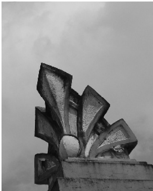
El Teatro Faenza, ejemplo del “período republicano” en Bogotá, abrió sus puertas al público en 1924.

mínimo en el número de gente que va de hecho a las urnas. En los Estados Unidos, la participación en las votaciones está normalmente en un 50% o menos 12 . Contando la gente que no se registra para votar, esto significa que aproximadamente un 25% de la población se convierte realmente en mayoría efectiva, en fuerza gobernante. El rango de