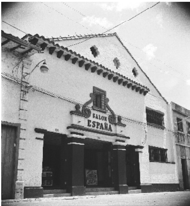
Fachada del Teatro Salón España, Medellín, 1947.

En resumen, una serie de problemas han complicado las esperanzas de igualdad política, inclusión, poder compartido y amplia participación de una población más cultivada por el uso creciente de sistemas tecnológicos. Las visiones estáticas de la “tecnodemocracia” han fallado históricamente en su renuencia a reconocer las complejas circunstancias sociales, organizativas y políticas en las que las tecnologías estaban inmersas. No obstante, la recurrencia de malformaciones y desórdenes relacionados con la tecnología nunca han acallado los sueños de renovación. Tan pronto como un nuevo mecanismo tecnológico aparece en escena, todas las historias y problemas del pasado son simplemente olvidadas, y reemplazadas por una confianza renovada en que la sociedad ha tropezado por fin con algo maravilloso y sin precedentes.