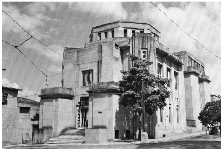
Fachada del Teatro de Bellas Artes (Cr. Córdoba por la Playa), Medellín 1940.

Las encomiendas de este tipo no estuvieron limitadas a los aparatos de comunicación. El avión, el automóvil, los plásticos, los electrodomésticos, y las grandes presas y sistemas del agua, fueron ampliamente elogiados y considerados