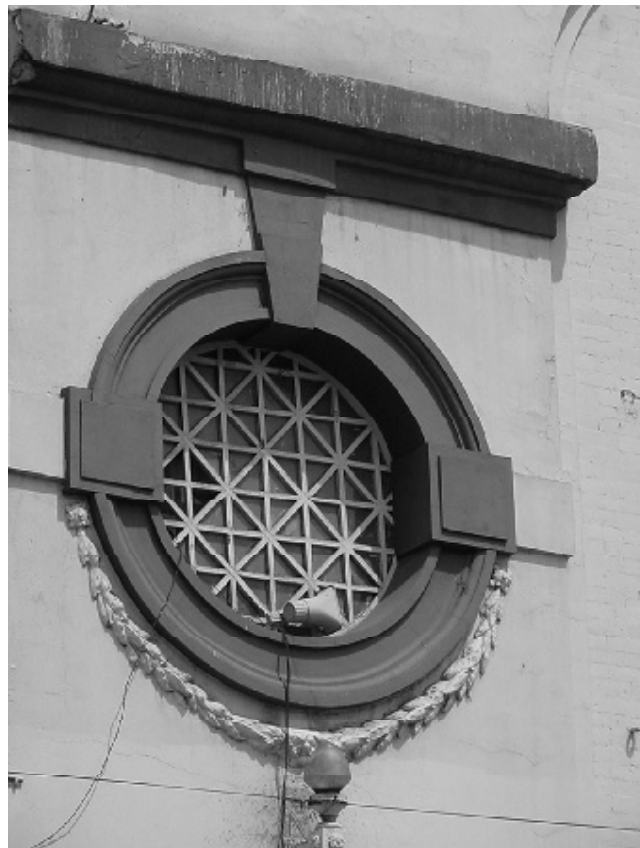
La construcción del Teatro aprovechó la antigua fábrica de porcelana “Faenza”.

dencia actual se dirige hacia la total fusión de Internet y televisión en un futuro no muy lejano, parece probable que las prácticas más lamentables de recaudación de fondos se transfieran sin más al nuevo medio del ciberespacio. Las redes de ordenadores podrían convertirse fácilmente en recursos con los que personas adineradas y diferentes organizaciones compren el ac-