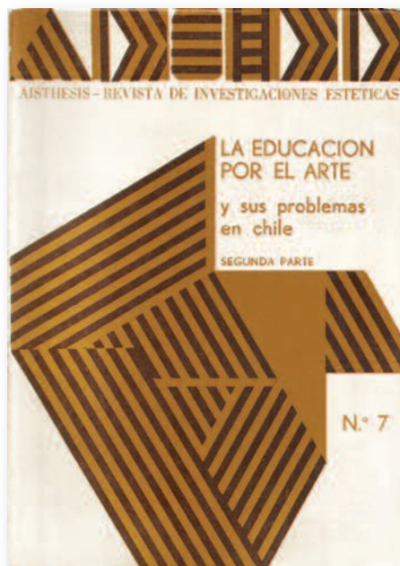
Portada del séptimo número de la revista Aisthesis , dedicada a la educación estética en Chile.

Como se puede notar de lo anterior, en este periodo de nuestra historia, tanto el arte como la cultura y la educación son considerados elementos indispensables para contribuir a una transformación social que atienda no solo a un cambio económico y social, sino sobre todo a una modificación en las estructuras de pensamiento dependientes para potenciar un sujeto colectivo, consciente y maduro 3 ; propuesta que sufrió un duro revés con el golpe de Estado de 1973 para entrar en una etapa de sobrevivencia y limitaciones profundas, que también podemos notar en la historia de la revista.