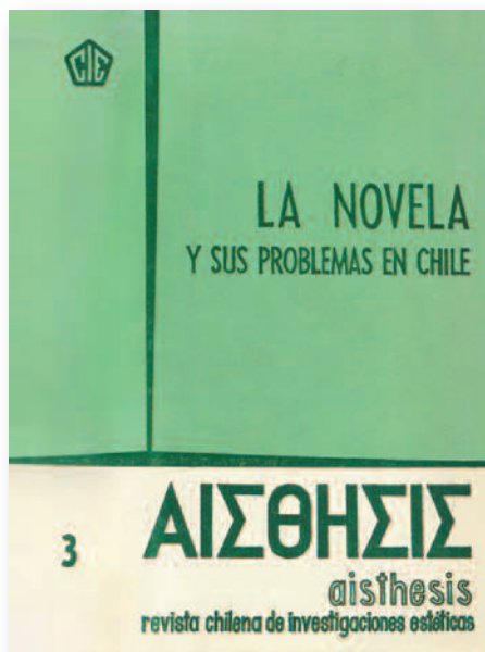
Portada del tercer número de la revista Aisthesis , dedicada a los problemas de la novela en Chile.

que, para PEC , constituye un ejemplo de ausencia de interés por acercarse a un lector menos docto a la promoción del arte y la cultura. Curiosamente, esta crítica de PEC , revista ligada a la derecha chilena y posteriormente cuestionada por su filiación con el Instituto por la Libertad, financiado por la CIA, aduce a propósito del artículo de Ivelic “confesamos honradamente no entender nada...” (347), aunque no hay reparos para alabar el trabajo publicado en ese mismo número por el crítico Alone: “Desde este mismo punto de vista es que consideramos excelente, jugoso, vivaz e incisivo el artículo de Alone, que destaca casi sorprendente en esta fronda” (347).